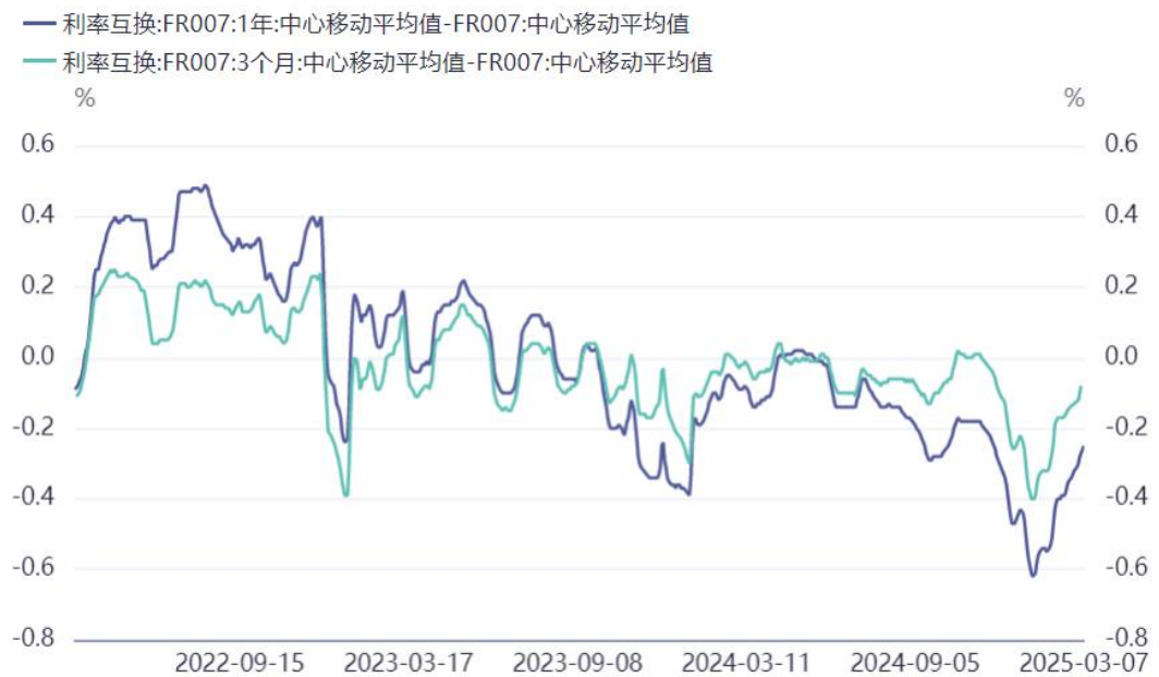
图表2: 过度计价的降息预期得到修正