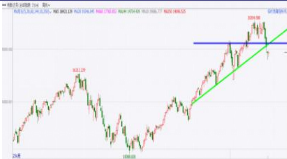
图表6: 纳斯达克处于空头趋势中