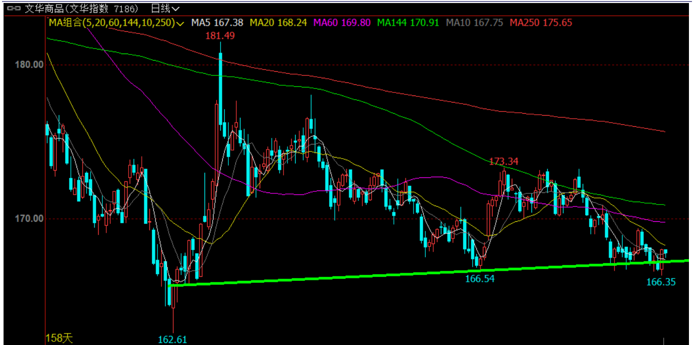
图表9: 文华商品指数突破颈线压制, 多头信号明显