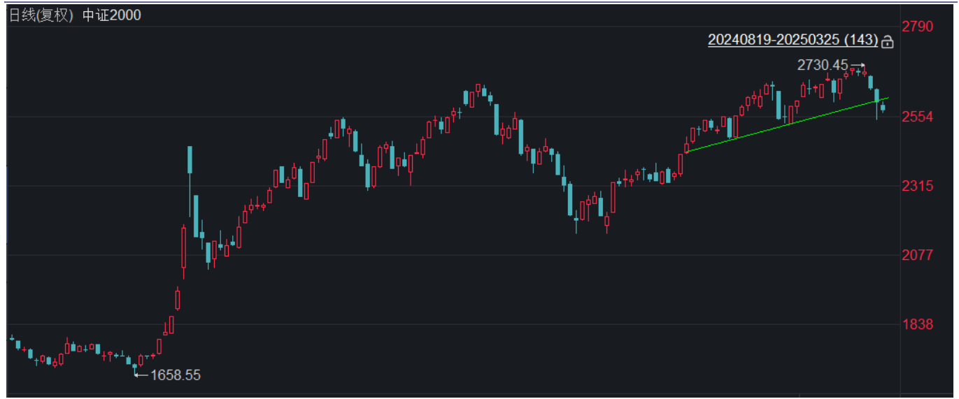
图表4: 中证2000 率先破位