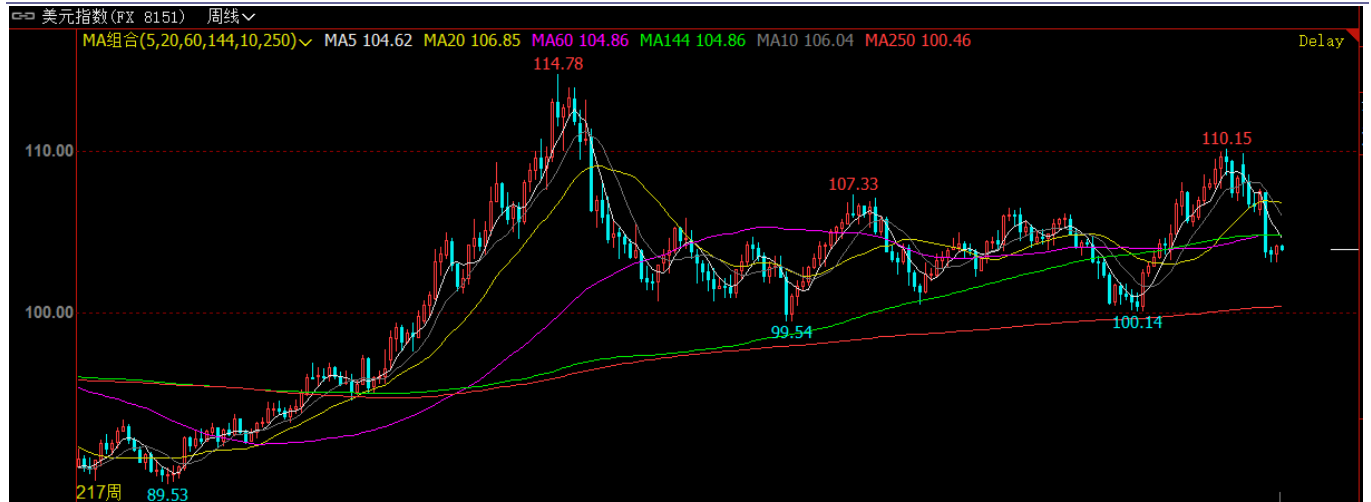
图表8: 美元短期利空不跌, 预计短期将延续反弹