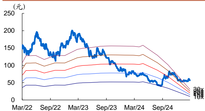
图 1: 舍得酒业历史 PE Band