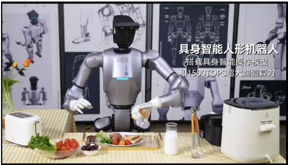
图表：Dobot Atom实现灵巧操作