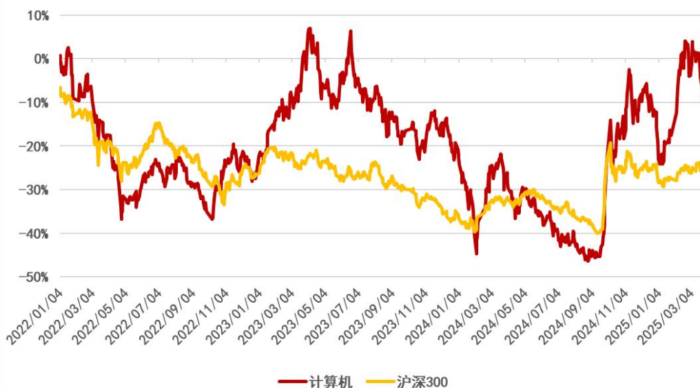
图 1：申万计算机行业 2022 年初至今行情走势（单位：%）（截至 2025 年 3 月 27 日）

申万计算机板块近 2 周（2025/3/14-2025/3/27）累计下跌 7.75%，跑输沪深 300 指数 8.28 个百分点，在 31 个申万一级行业中排名第 31 名；申万计算机板块 3 月累计下跌 4.48%，跑输沪深 300 指数 5.57 个百分点；申万计算机板块今年累计上涨 8.70%，跑赢沪深 300 指数 8.76 个百分点。