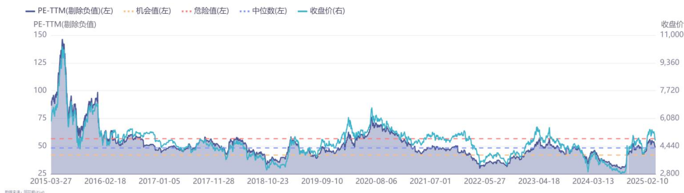
图 2：申万计算机板块近 10 年 PE TTM（单位：倍）（截至 2025 年 3 月 27 日）

截至 2025 年 3 月 27 日，据同花顺数据显示，SW 计算机板块 PE TTM（剔除负值）为 49.14 倍，处于近 5 年 67.38%分位、近 10 年 54.55%分位。