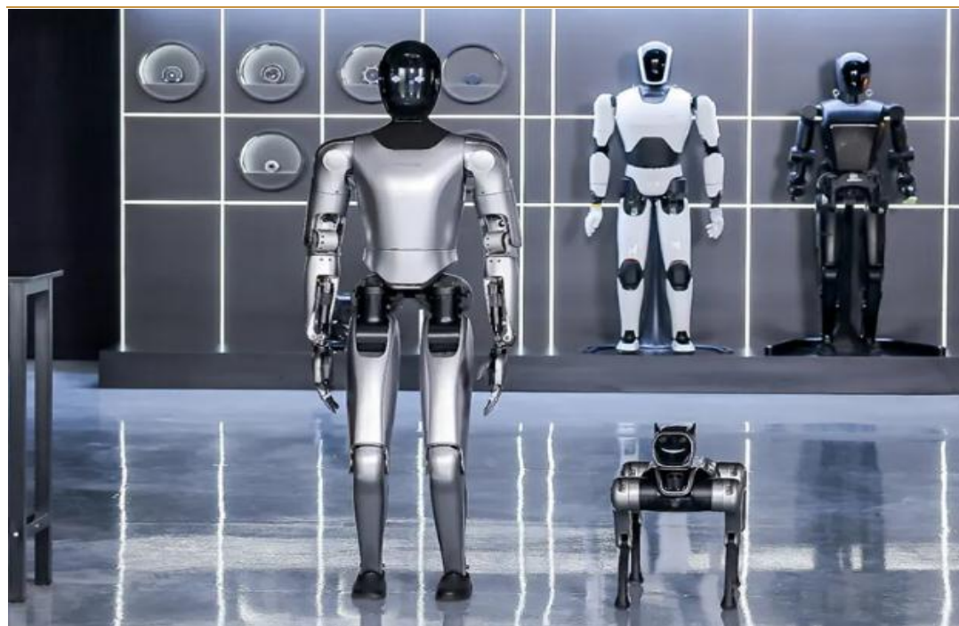
图 3：魔法原子正式推出人形机器人和四足机器人

魔法原子举办 2025 场景战略发布会，官宣“千景共创计划”落地 1000 个应用场景。3 月 26 日，魔法原子举办「原子双生」2025 场景战略发布会，正式推出人形机器人和四足机器人，并首次推出端到端“原子万象大模型”。宣布启动“千景共创计划”计划，将围绕人形机器人落地，拓展 1000 家合作伙伴，打造 1000 个人形机器人落地应用场景。