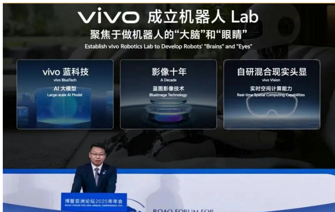
图 2：vivo 官宣成立机器人 Lab，进军家庭机器人赛道