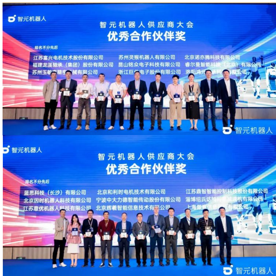
图 4：智元机器人优秀供应商

智元举办首届供应商大会。 3月26日，智元机器人首届供应商大会在上海成功举办。自成立以来，智元机器人取得了一系列令人瞩目的成绩。成立半年发布首款产品远征 A1，2024 年 1 月制造工厂落地上海，8 月发布远征 A2 及灵犀 X1 等系列产品，9 月自建 3000+ 平数采工厂。在今年 1 月，智元更是完成了累计量产下线 1000 台通用具身机器人的行业壮举，刷新行业记录。