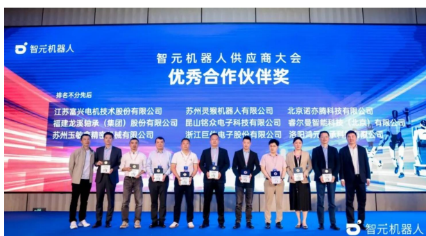
图1：智元供应商大会照片 1

2025 年 3 月 26 日，智元机器人首次在上海举办盛大的供应商大会，参会供应商超 200 家。会上，智元机器人向包括龙溪股份、蓝思科技、中大力德、博众精工、鼎智科技等多家企业授予“优秀供应商”称号，表彰他们在技术创新、交付效率及服务品质上的杰出表现。智元机器人首次全面披露了技术发展蓝图与供应链战略。未来 5 到 10 年，智元机器人希望逐步实现每年量产 1 万至 100 万台人形机器人的目标。