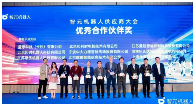
图2：智元供应商大会照片 2