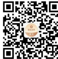
【公众号】 国金证券研究