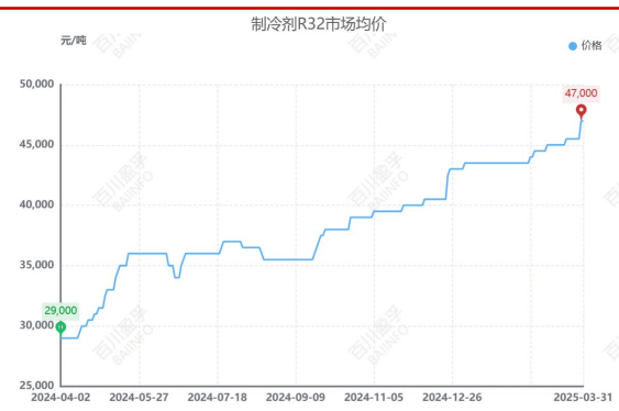
图 2：近一年来制冷剂 R32 价格走势（截至 3 月 31 日）