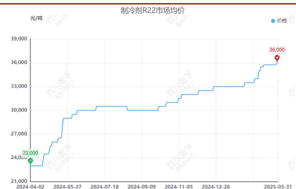
图 1：近一年来制冷剂 R22 价格走势（截至 3 月 31 日）