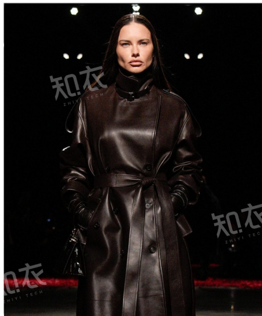
Salvatore Ferragamo 菲拉格慕