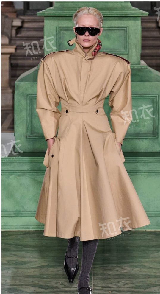
Kent & Curwen 肯蒂文肯迪文