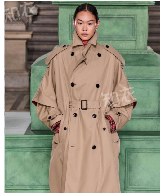
Kent & Curwen 肯蒂文肯迪文