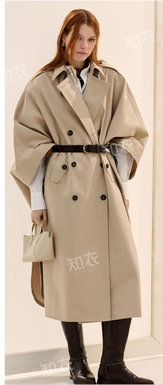
Brunello Cucinelli 布鲁奈罗·库奇内