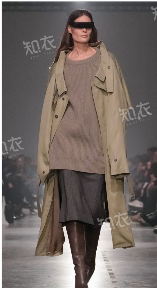
MM6 Maison Margiela