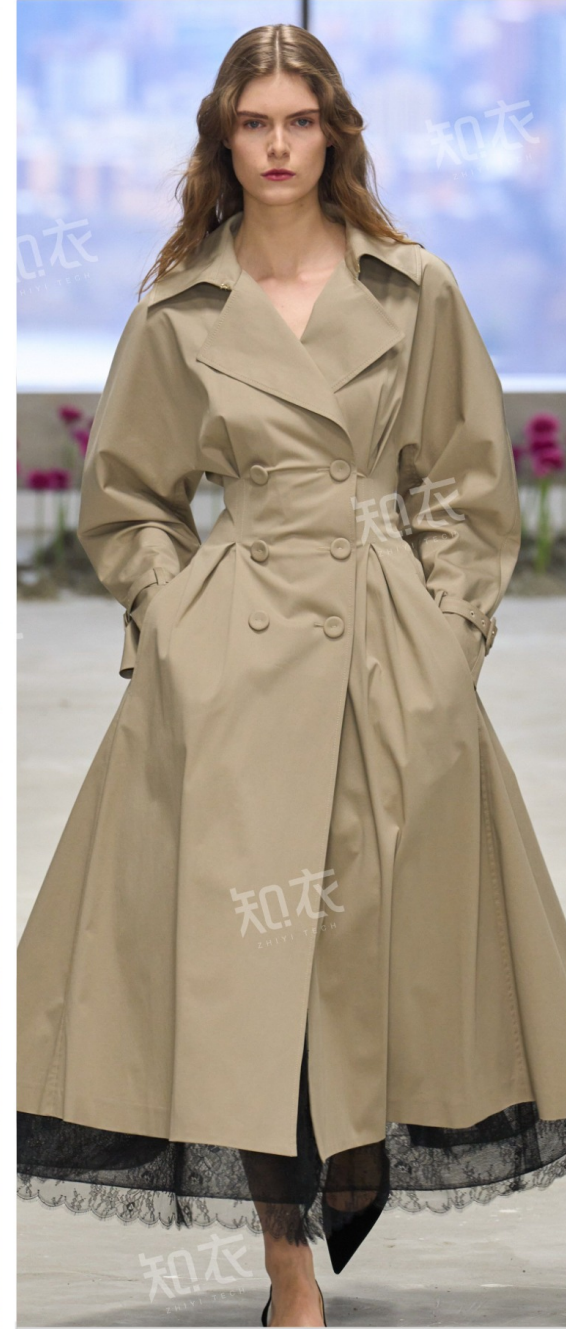
Carolina Herrera 卡罗琳娜-海莱娜