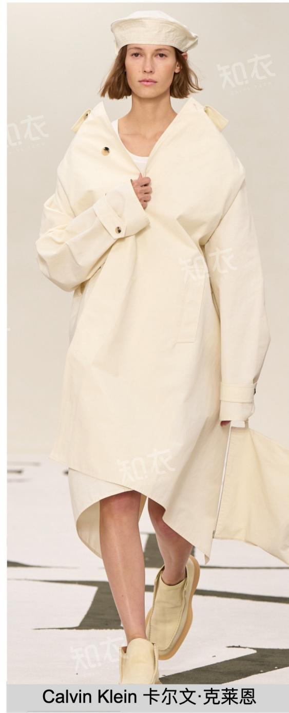
Calvin Klein 卡尔文·克莱恩