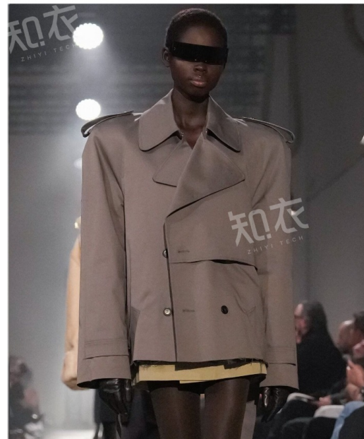
MM6 Maison Margiela