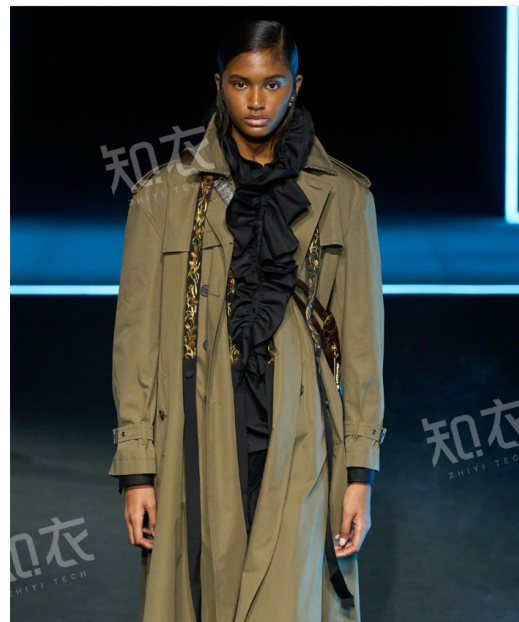
Christian Dior 克里斯汀·迪奥