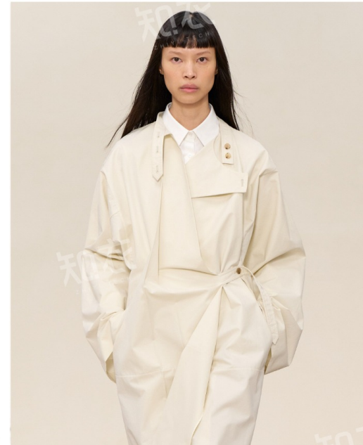
Calvin Klein 卡尔文·克莱恩