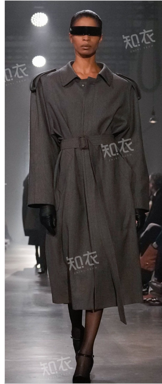
MM6 Maison Margiela