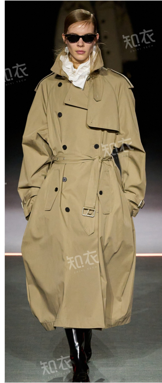
Christian Dior 克里斯汀·迪奥