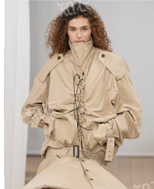
Institut Français de la Mode