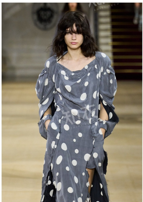
Vivienne Westwood 维维安·韦斯特伍