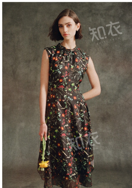
3.1 Phillip Lim 3.1 菲利普林

花卉图案在秋冬换上深邃底色，勾勒出迷离梦境般的浪漫氛围。墨黑、深紫、酒红等沉静色调衬托花朵的层次感，仿佛夜幕下的盛放之境。模糊晕染、立体刺绣、丝绒压花等工艺让花卉更具艺术气息，为秋冬增添一抹神秘魅力。