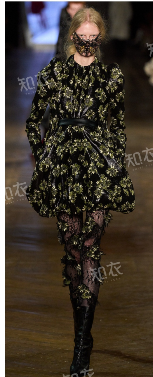
Alexander McQueen 亚历山大·麦昆