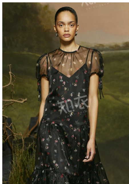
Cinq à Sept