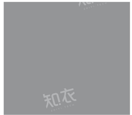
PANTONE 17-5104 TCX 终极灰

经典且永不过时的终极灰，在本季作为极简主义和实用风格的代表色。它平衡了冷暖调，使其在不同材质上都能展现不同的质感。适用于通勤西装、极简风连衣裙，或是带有未来感的单品设计。