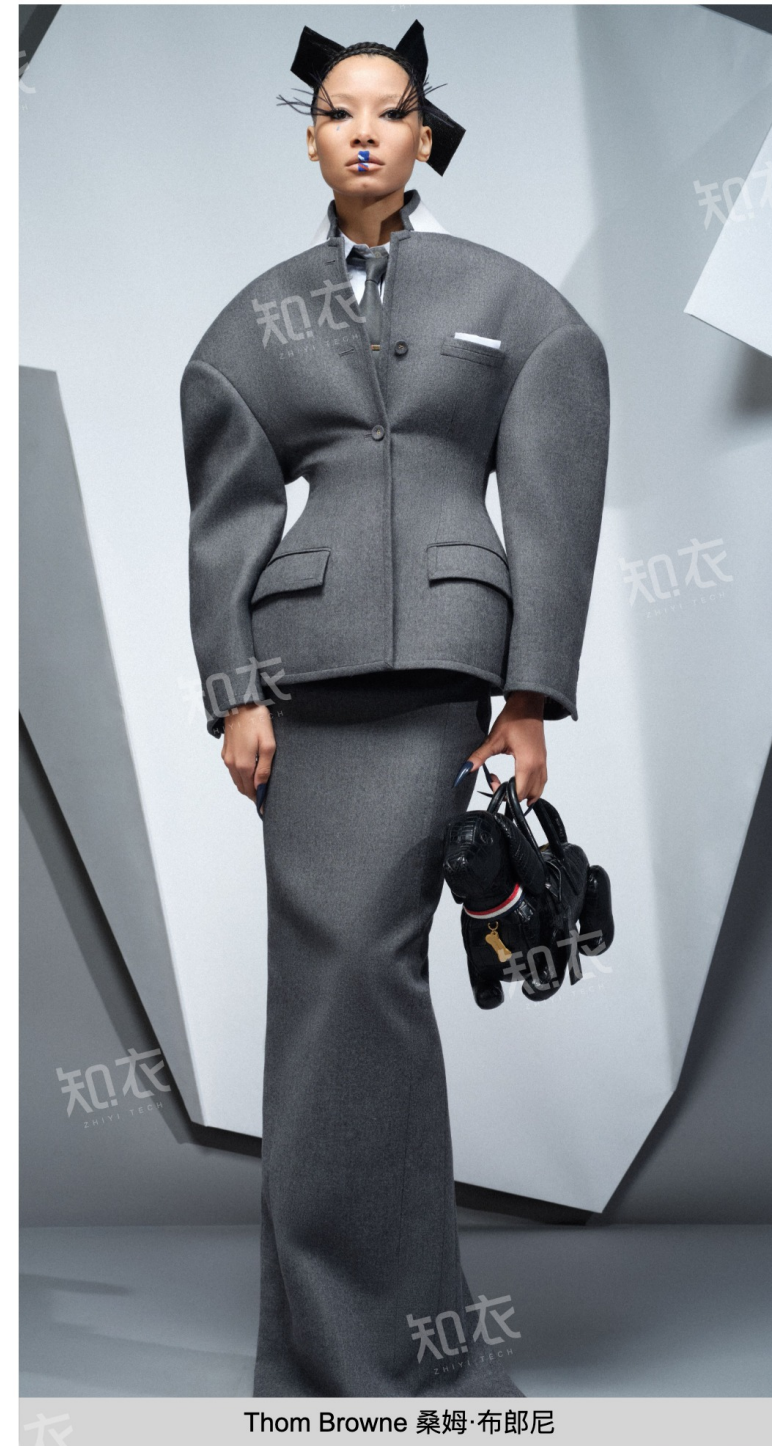
Thom Browne 桑姆·布朗尼