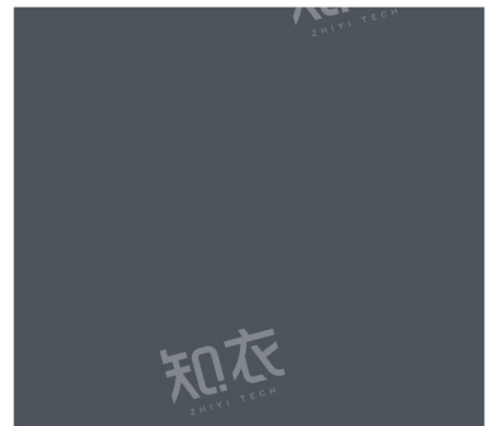
PANTONE 19-4215 TCX 湍流色

湍流色是一种略带蓝调的冷灰色调，赋予服装灵动的现代感。它象征着力量与变化，适用于都市运动风与未来科技风的设计，如科技感外套、拼接运动单品，或是带有流体纹理的丝质裙装。