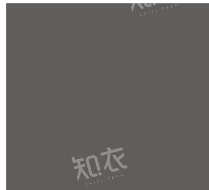
PANTONE 18-0403 TCX 深暗灰

深邃而神秘的深暗灰，是本季最具稳重感的色彩之一。它具有工业金属的沉静质感，也蕴含着夜幕降临时的冷峻氛围。适用于解构主义廓形、皮革单品或现代摩登风格的西装，为穿搭带来低调而高级的层次感。