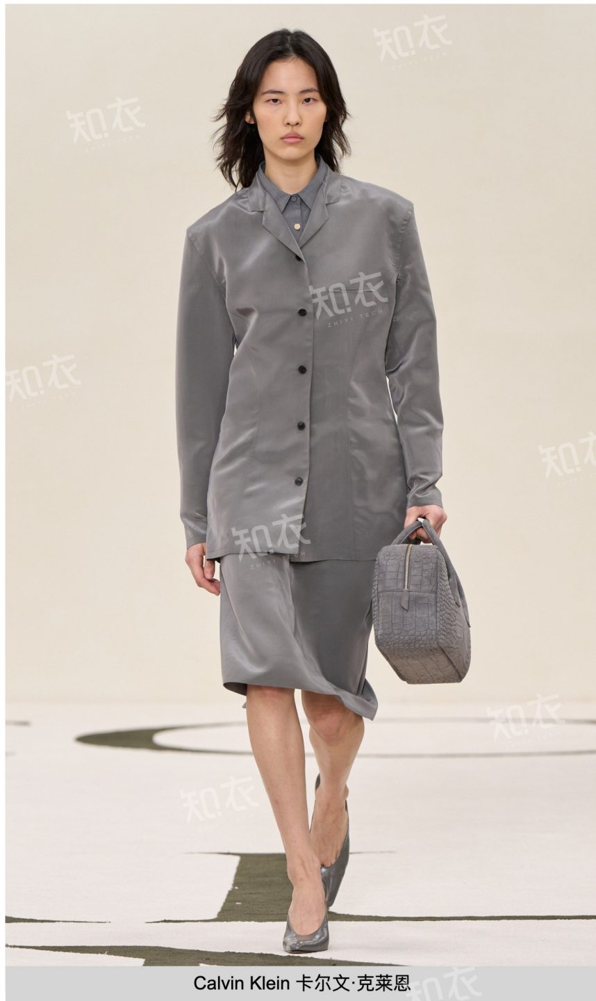
Calvin Klein 卡尔文·克莱恩