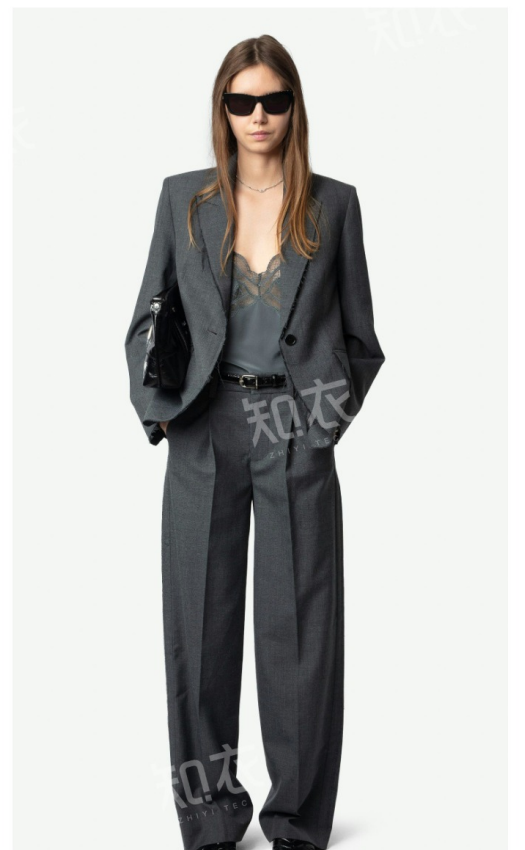
Zadig & Voltaire 萨迪格&伏尔泰