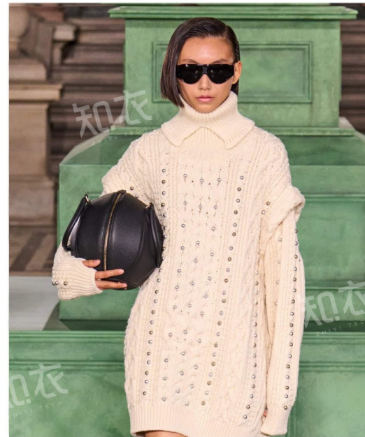
Kent & Curwen 肯蒂文肯迪文