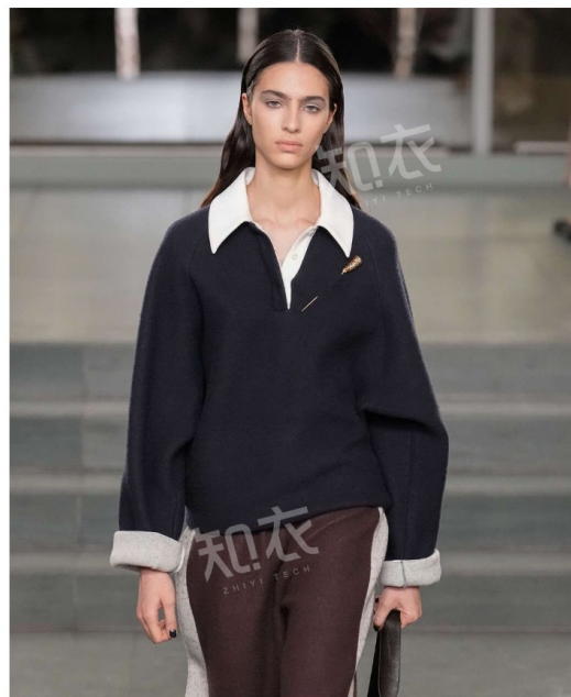
Tory Burch 汤丽柏琦