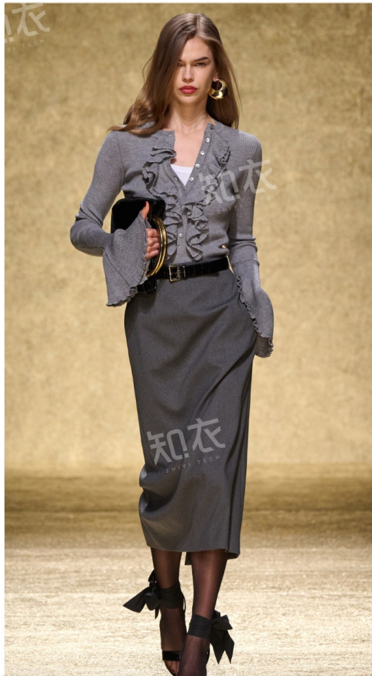
Luisa Spagnoli 路易莎斯帕格诺利