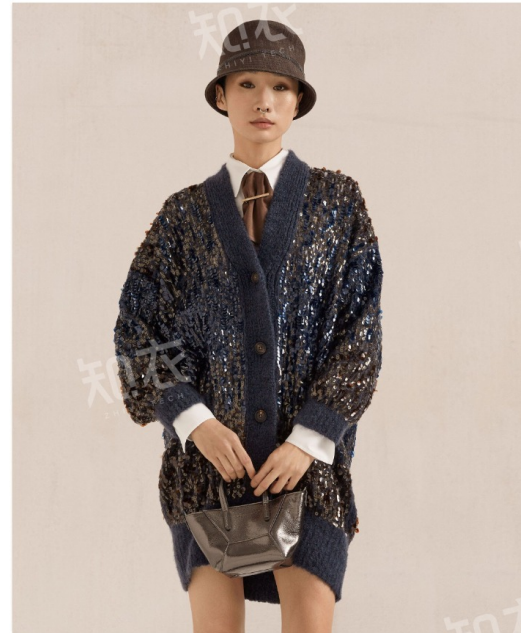
Brunello Cucinelli 布鲁奈罗·库奇