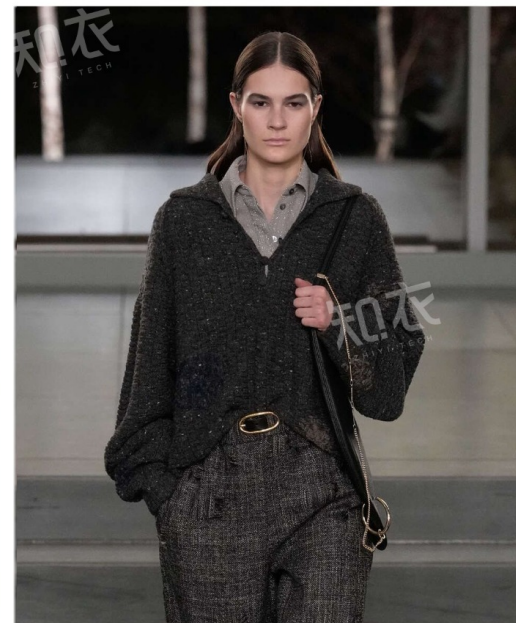
Tory Burch 汤丽柏琦