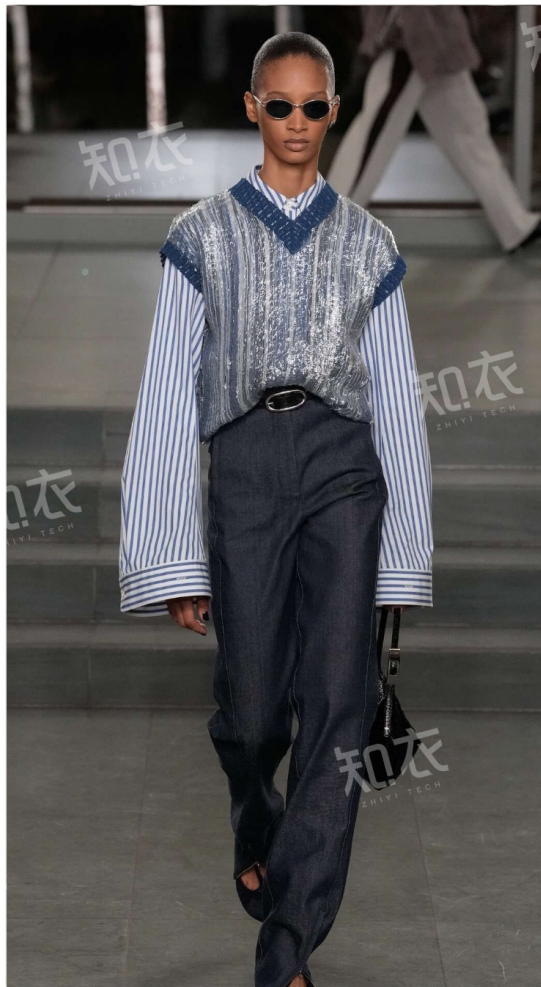
Tory Burch 汤丽柏琦