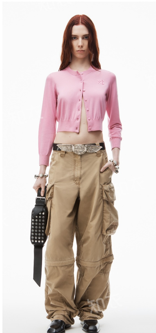
Alexander Wang 亚历山大·王