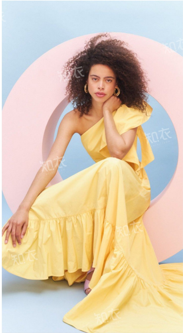
Luisa Spagnoli 路易莎斯帕格诺利