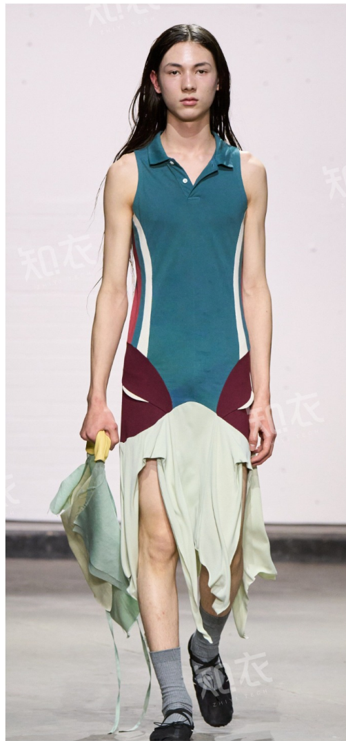
Central Saint Martins Ma