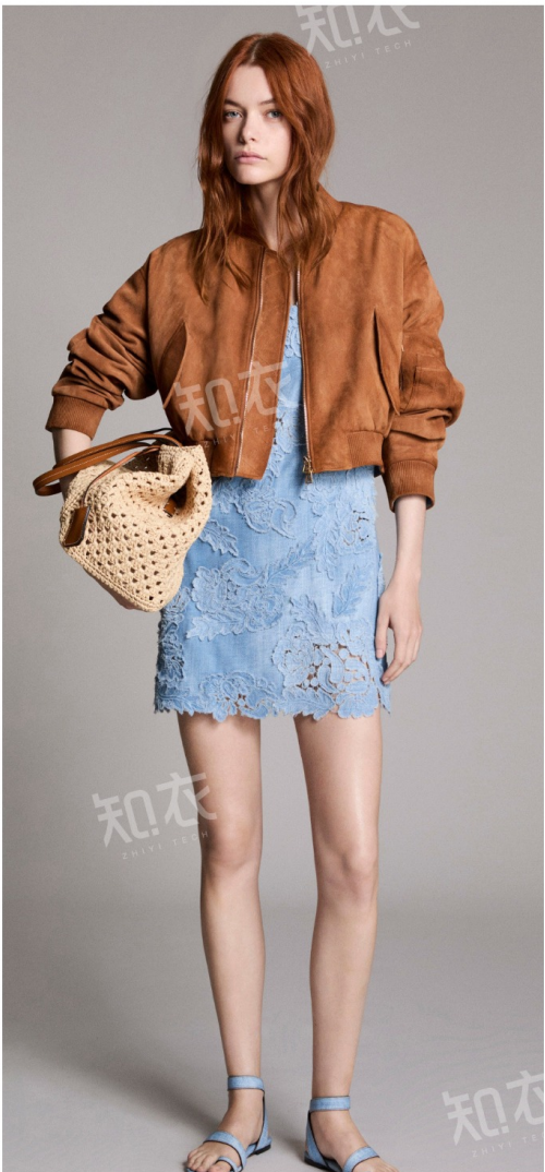
Ermanno Scervino 艾尔玛诺·谢尔维诺