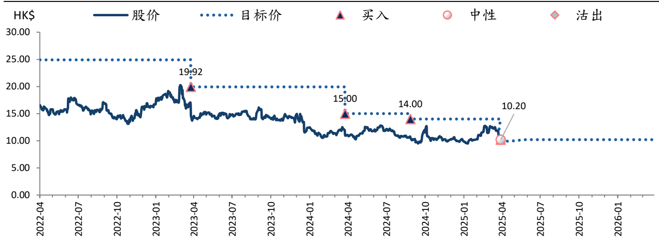
图表 2: 网龙网络 (777 HK) 目标价及评级