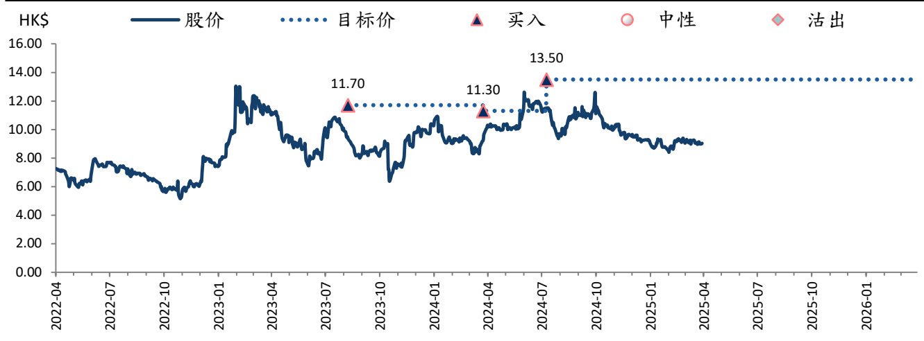
图表 2: 顺丰同城 (9699 HK) 目标价及评级