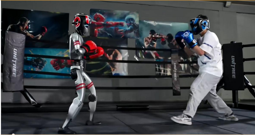
图 2：宇树科技发布人形机器人 G1 拳击视频