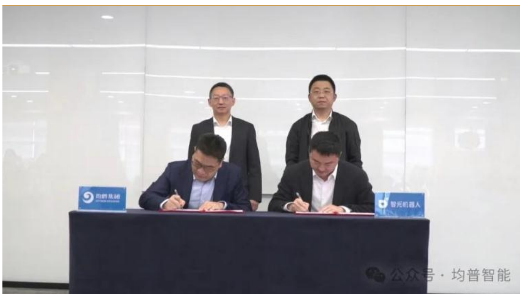
图 4：均胜集团与智元机器人签署战略合作协议

此外，普智机器人公司将向智元机器人提供机器人本体总装生产线设备、检测和测试设备等；同时将依托均普智能的全球化布局网络，在海外搭建机器人生产线，并推动产品在海外的销售。除机器人本体的研发生产外，普智机器人公司也将在智元机器人成熟的方案、产品和技术的基础上自主设计、生产轮式机器人。