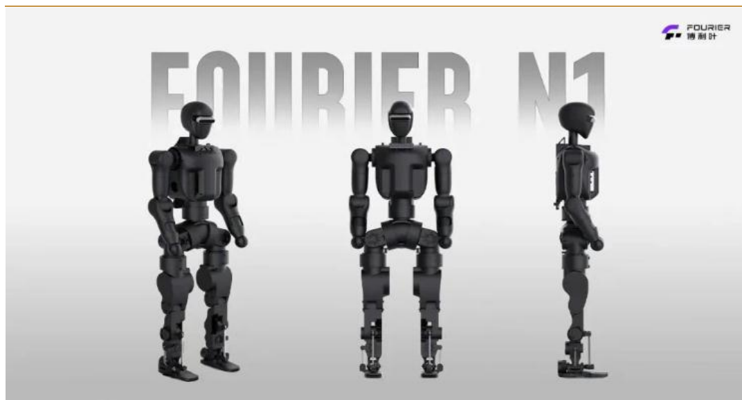
图 5：傅利叶发布首款开源人形机器人 Fourier N1

今年 3 月，傅利叶已正式发布全尺寸人形机器人数据集 Fourier ActionNet，并推出全球首个覆盖采集、标注、训练、评估的全流程工具链。此次 N1 开源是傅利叶打造“硬件+算法+数据”三位一体开放体系的又一核心举措。