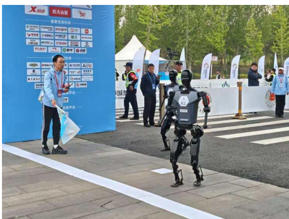
图1：北京亦庄半程马拉松比赛现场图 1

2025 年 4 月 19 日，全球首场“人机共跑”半程马拉松——北京亦庄半程马拉松暨人形机器人半程马拉松正式鸣枪开跑。这场具有里程碑意义的赛事吸引了来自北京、上海、广东等地的 20 支人形机器人队伍与约 1.2 万名人类跑者同场竞技，共同挑战 21.0975 公里的复杂赛道。北京人形机器人创新中心的“天工 Ultra”以最高 12 公里/小时的速度率先冲线，最终以 2 小时 40 分完赛夺冠。身高 1.2 米的松延动力 N2 小顽童队获得亚军，来自上海卓益德机器人有限公司的行者 2 号机器人赢得季军。