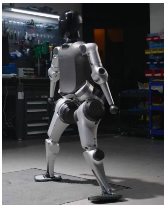
图4: 松延动力 N2 人形机器人实物图