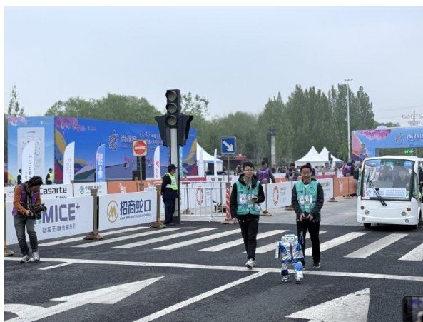
图2：北京亦庄半程马拉松比赛现场图 2