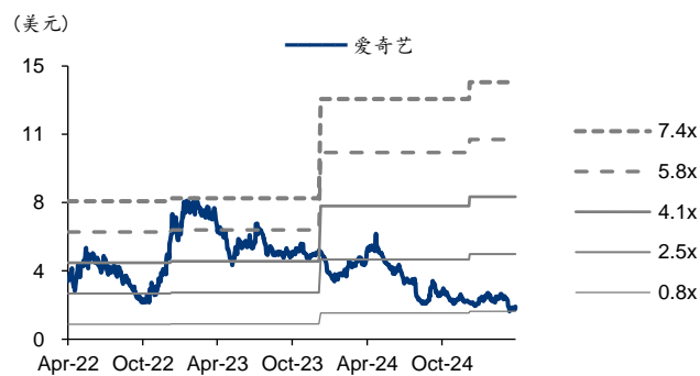
图表5: 爱奇艺 PB-Bands