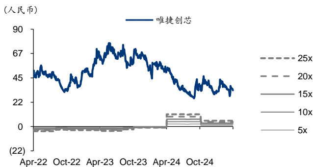
图表3: 唯捷创芯 PE-Bands

注: P/E 及 ROE 平均值计算剔除负数或异常值 资料来源: Wind, 华泰研究