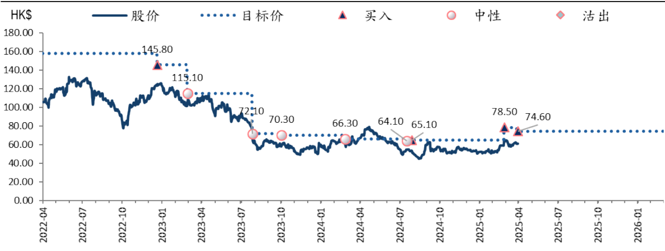
图表 3: 新奥能源 (2688 HK) 目标价及评级