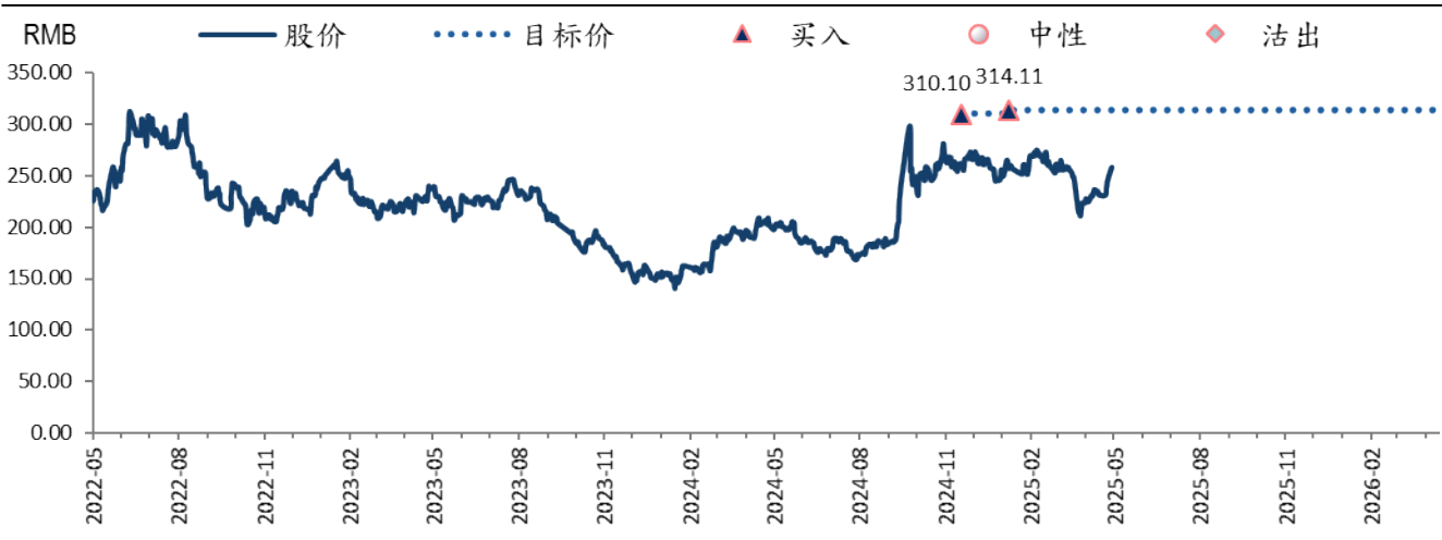
图表 2：宁德时代 (300750 CH) 目标价及评级