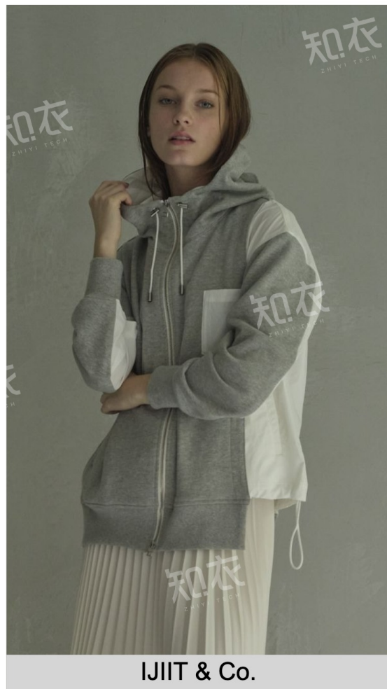
IJIIT &amp; Co.