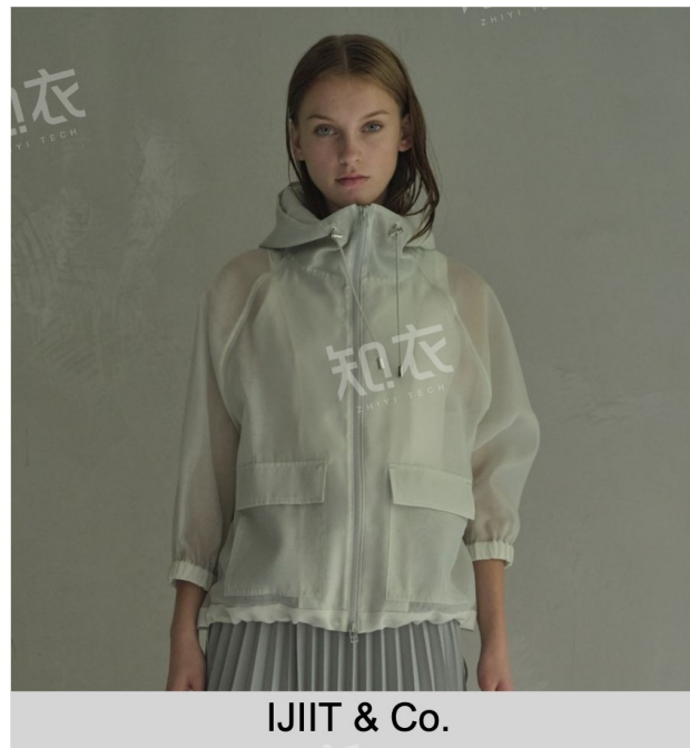
IJIT &amp; Co.