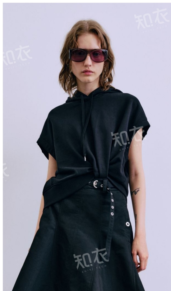
3.1 Phillip Lim