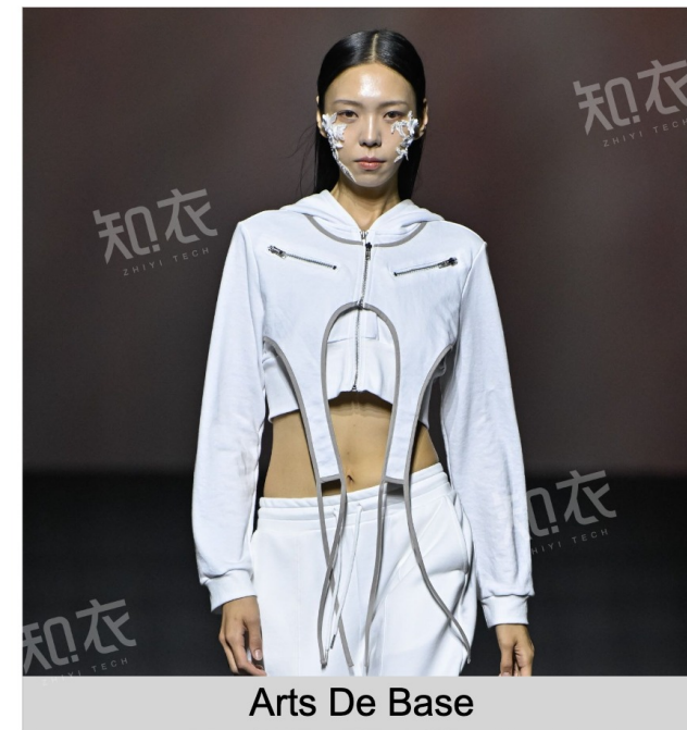
Arts De Base