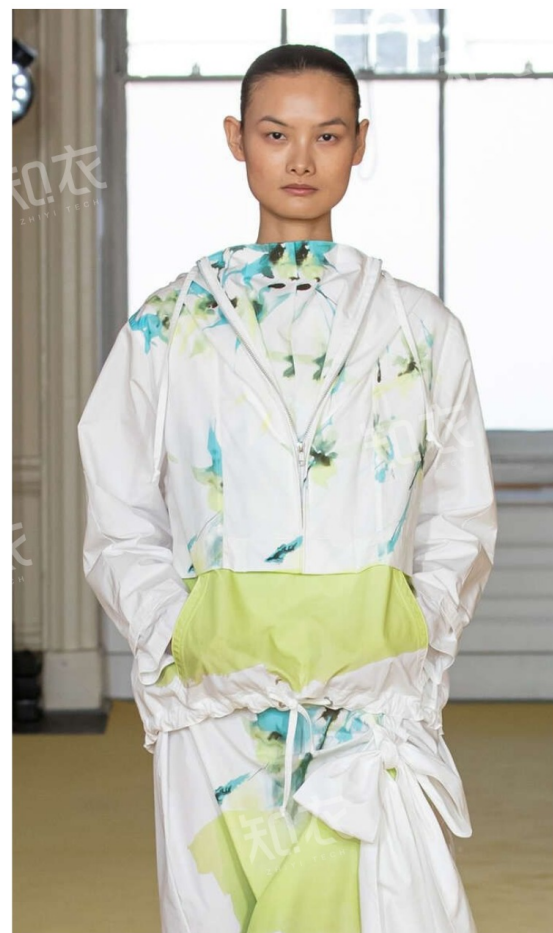
Noon By Noor