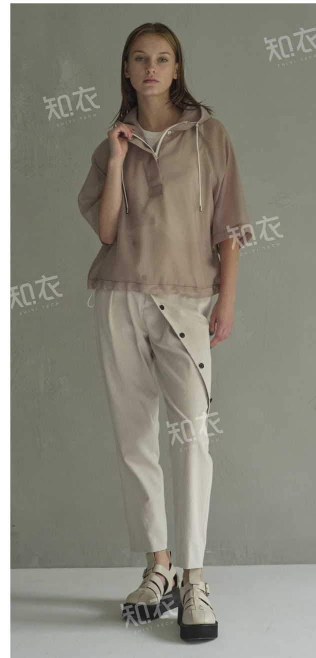
IJIIT &amp; Co.