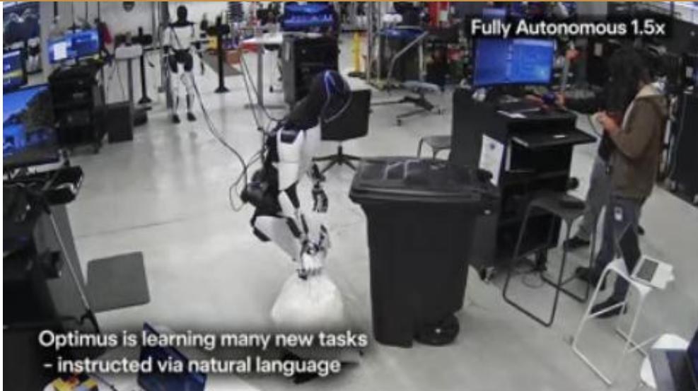
图 2：特斯拉展示 Optimus 做家务能力

下一步，团队计划扩展到第三人称视频的转移学习（即随机互联网视频），并通过在真实世界或合成世界（模拟 / 世界模型）中进行自我强化学习（RL）来提高机器人的可靠性。