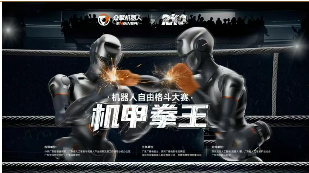
图 4：众擎机器人官宣全球首个全尺寸“机甲拳王”格斗赛

众擎机器人官宣全球首个全尺寸“机甲拳王”格斗赛。 5月22日，深圳众擎机器人公司等官宣了首个以“全尺寸类人身高”的人形机器人为竞技主体的赛事“众擎机器人自由格斗赛之‘机甲拳王’”。据赛事组委会介绍，众擎机器人公司将提供多款不同属性的最新人形机器人，开源代码，提供给各参赛队伍，他们将以人形机器人格斗俱乐部的形式参加比赛。接下来，主办方还会持续升级迭代赛事，目标将机器人竞技项目推进奥运会，开创人机共融的奥林匹克新时代。