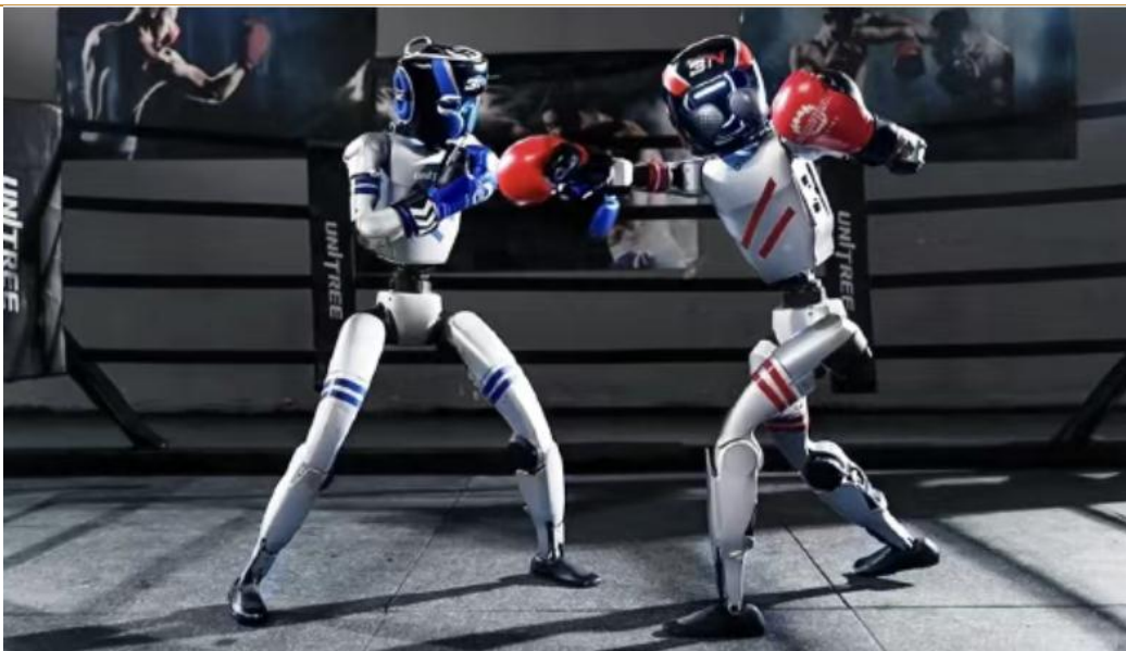
图 3：宇树科技将于 5 月 25 日直播首个人形机器人格斗大赛

宇树科技将于 5 月 25 日直播首个人形机器人格斗大赛。《CMG 世界机器人大赛·系列赛》机甲格斗擂台赛正式定档，将于 5 月 25 日在杭州举行，宇树科技将以合作方身份参加比赛。约一个月前，宇树科技官微发布视频称，一直在为参加格斗大赛的机器人进行技术研发调试和算法训练。据悉，该场比赛由表演赛和竞技赛两部分组成。在表演赛中，人形机器人将挑战并展示人类传统体育项目——格斗，包括单机格斗展示和群体格斗展示等多个环节。竞技赛方面，共设置四支参赛队伍，由来自不同领域的操控者实时操作，通过多轮格斗比拼，决出最终优胜者。大赛将通过中央广播电视总台央视科教频道全程直播。