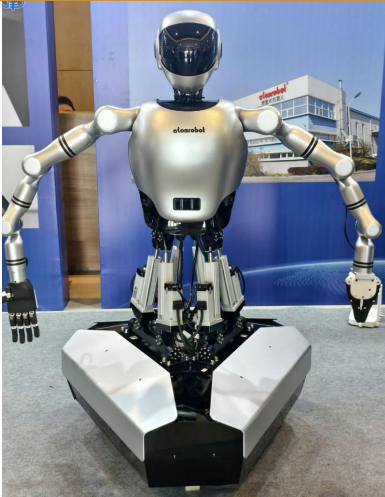
图 5：津产首款人形机器人“天兵一号”亮相