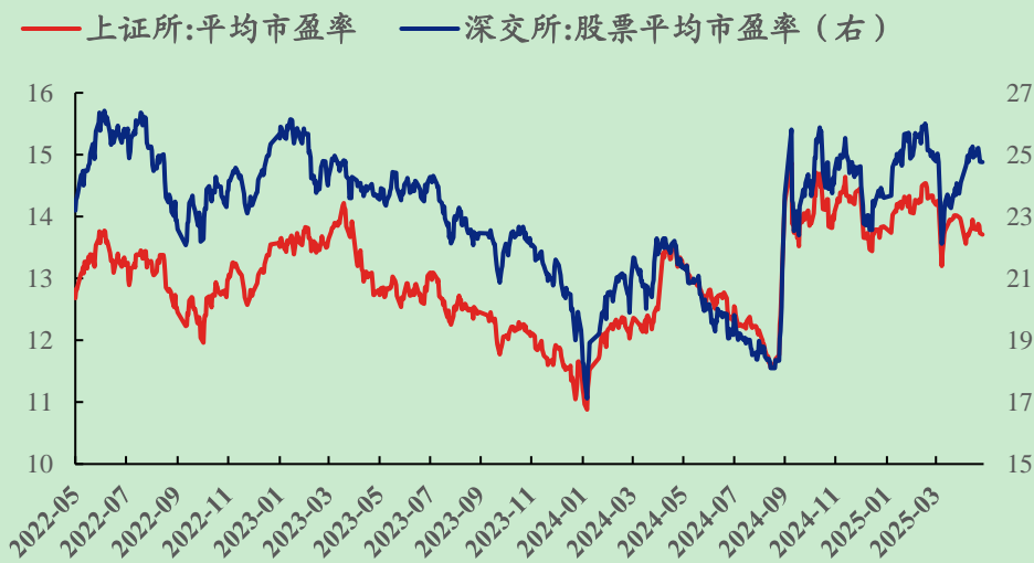
图 1: 最近三年沪深两市平均市盈率变化 (单位: 倍)