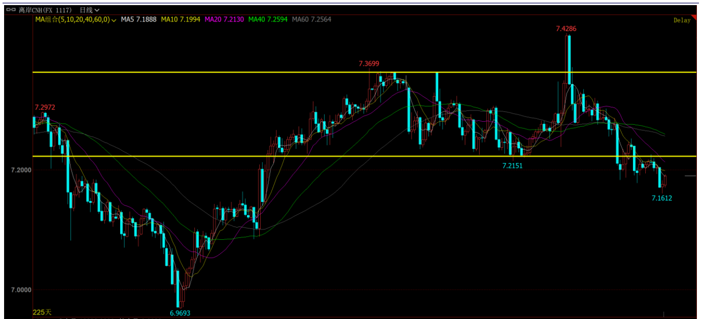
图表4: 贸易战恐慌缓和, 人民币大幅升值

在岸人民币兑美元北京时间 16:00 官方报 7.1888，较前一日收盘跌 25 个基点。在中美贸易超预期利好的影响下，人民币大幅升值。离岸人民币技术面走强的迹象较为明显，前高 7.42 可能成为本轮人民币贬值的高点。预计人民币有望升至 7.1 附近。值得注意的是此前汇率与股市的正相关性近日并没有显现，这或与升值主要依赖于市场对美国债务问题不信任导致美元疲弱有关。