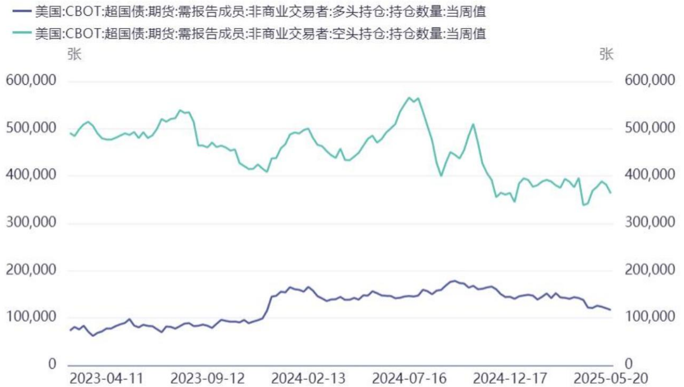
图表3：并不拥挤的头寸或暗示后续美债将发生趋势性的行情