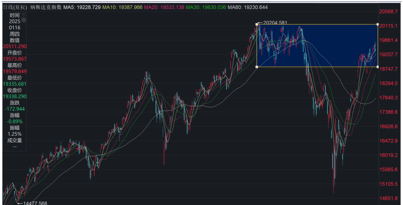
图表3：纳斯达克指数处于前期头部位置

后续市场研判： 美股目前震荡做头部整理的可能性最大，建议投资者短期规避，静待买点出现。