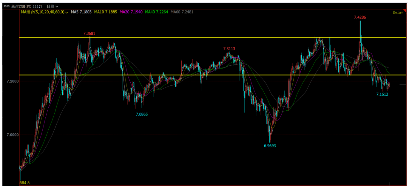
图表4：贸易战恐慌缓和，人民币大幅升值

在岸人民币兑美元北京时间 16:00 官方报 7.1886，较前一日收盘涨 52 个基点。在中美贸易超预期利好的影响下，人民币大幅升值。离岸人民币技术面走强的迹象较为明显，前高 7.42 可能成为本轮人民币贬值的高点。预计人民币有望升至 7.1 附近。