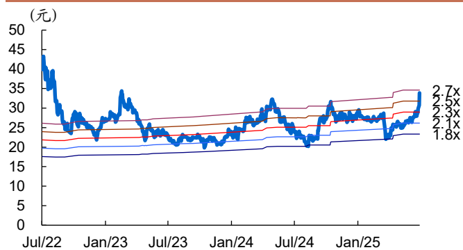
图 2: 中际联合历史 PB Band