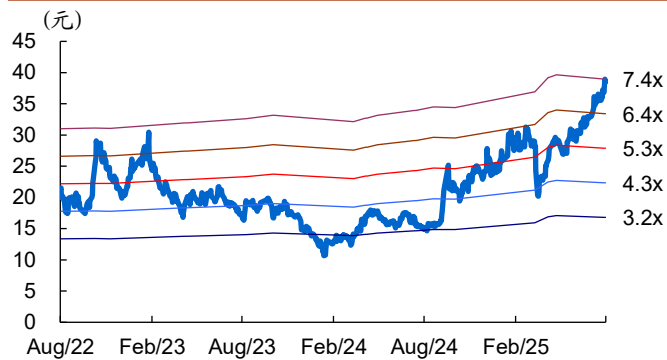
图 2: 道通科技历史 PB Band