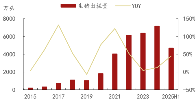
图 1: 2015-2025Q2, 公司生猪出栏量及其变化情况