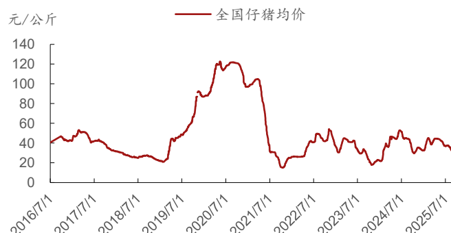
图 4: 2019-2025 年, 全国仔猪均价走势图