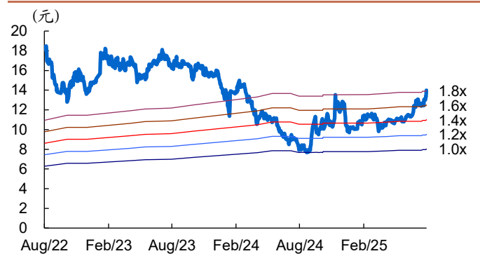
图 2: 万润股份历史 PB Band