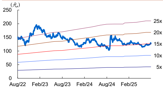
图 1: 五粮液历史 PE Band