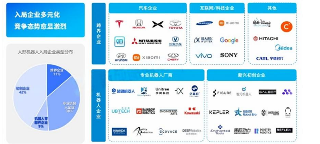
图4：人形机器人市场竞争格局

当前，随着行业快速扩张，竞争格局也在急剧分化。据新战略人形机器人产业研究所初步统计，截至 2025 年 4 月，全球人形机器人本体企业数量已超 300 家，中国企业数量更是超过 150 家，竞争局势日益激烈。从企业属性来看，在人形机器人本体研发企业中，成立五年以内的初创企业占比达到 42%，跨界企业占比 11%，涵盖家电、汽车、互联网等领域；专业机器人企业占比 38%，而机器人零部件企业占比 9%。