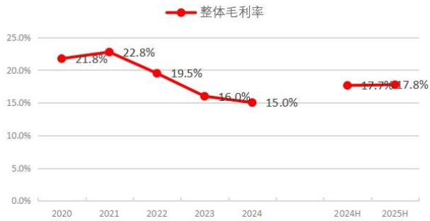
图 3:上半年毛利率为 17.8%，较去年同期上升 0.1pct