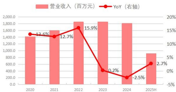
图 1:上半年营收同比增长 2.7%