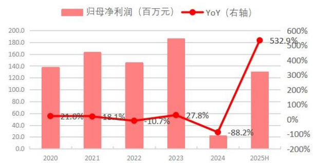
图 2:上半年归母净利润同比增长 532.9%