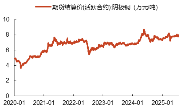
图 2: 2020 年-2025 年铜价走势

资料来源: Wind, 光大证券研究所, 数据截至 2025 年 8 月 22 日