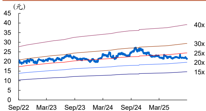
图 1: 国电南瑞历史 PE Band