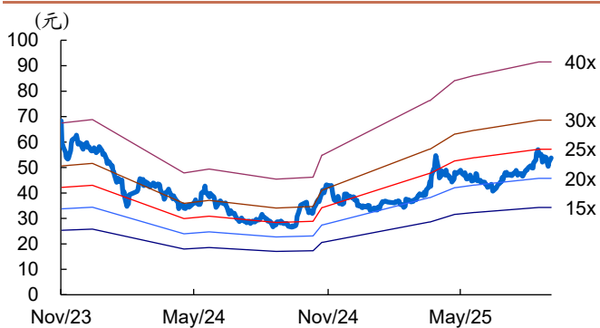
图 1: 麦加芯彩历史 PE Band