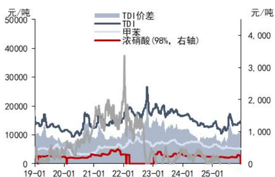
图3：TDI 价格与价差（元/吨）