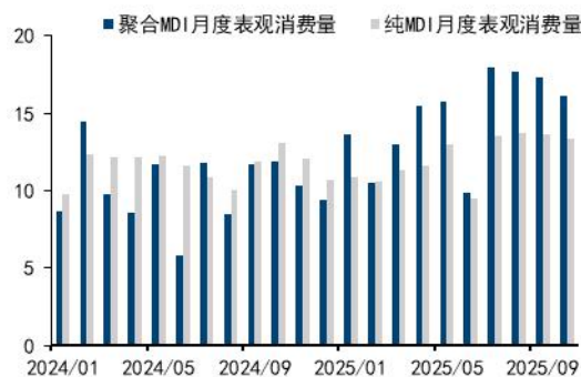
图8: 聚合及纯 MDI 月度表观消费量 (万吨)