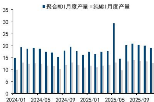
图7: 聚合及纯 MDI 月度产量 (万吨)