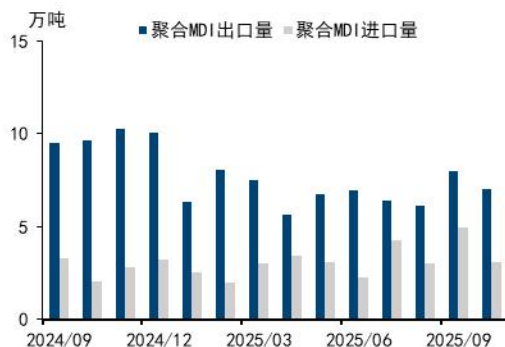
图5: 聚合 MDI 月度进出口量 (万吨)