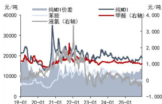
图1：聚合 MDI 价格与价差（元/吨）

截至 12 月 15 日，聚合 MDI 市场价格上涨至 15050 元/吨，较上周上涨 100 元/吨，较上月上涨 500 元/吨；纯 MDI 市场价格 19300 元/吨，较上周下跌 200 元/吨，较上月上涨 300 元/吨。自 12 月 8 日起，万华化学上调中东、非洲和土耳其纯 MDI、聚合 MDI 价格 350 美元/吨。12 月 9 日沙特 40 万吨 MDI 装置计划 2026 年 1 月初开始停车检修，预计持续时间 1 个月左右；12 月 12 日因上游原料氯气供应短缺及设备检修，巴斯夫位于比利时安特卫普年产 65 万吨的 MDI 装置低负运行，预计将持续低负运行至明年 3 月装置检修结束后。万华福建 MDI 技改扩能项目预计将于 2026 年二季度新增 70 万吨产能，万华福建第二套 33 万吨 TDI 项目预计今年建成投产，届时 MDI 和 TDI 产能将分别达 450 和 144 万吨。