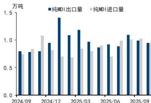
图6: 纯 MDI 月度进出口量 (万吨)