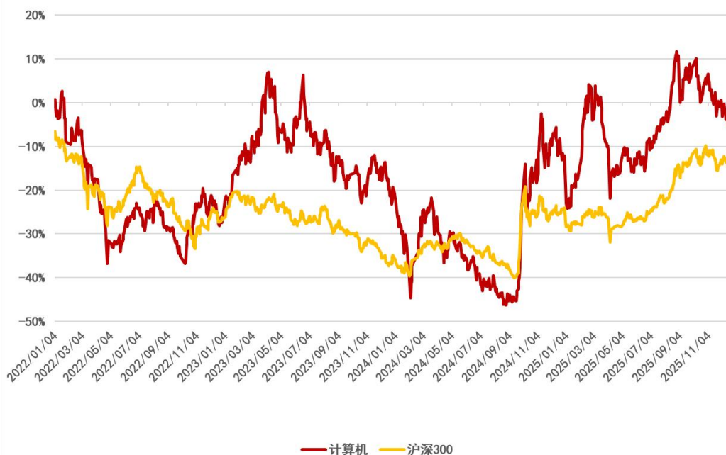
图 1：申万计算机行业 2022 年初至今行情走势（单位：%）（截至 2025 年 12 月 25 日）

申万计算机板块近 2 周（2025/12/12-2025/12/25）累计上涨 2.09%，跑赢沪深 300 指数 0.11 个百分点，在 31 个申万一级行业中排名第 19 名；申万计算机板块 12 月累计下跌 1.78%，跑输沪深 300 指数 4.34 个百分点；申万计算机板块今年累计上涨 16.43%，跑输沪深 300 指数 1.55 个百分点。