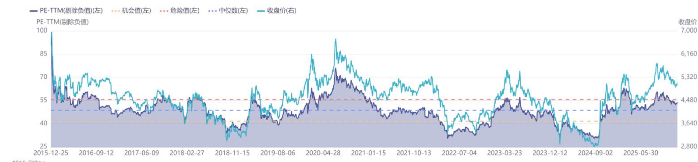
图 2：申万计算机板块近 10 年 PE TTM（单位：倍）（截至 2025 年 12 月 25 日）

截至 2025 年 12 月 25 日,据同花顺数据显示,SW 计算机板块 PE TTM(剔除负值)为 54.02 倍,处于近 5 年 87.45%分位、近 10 年 74.19%分位。