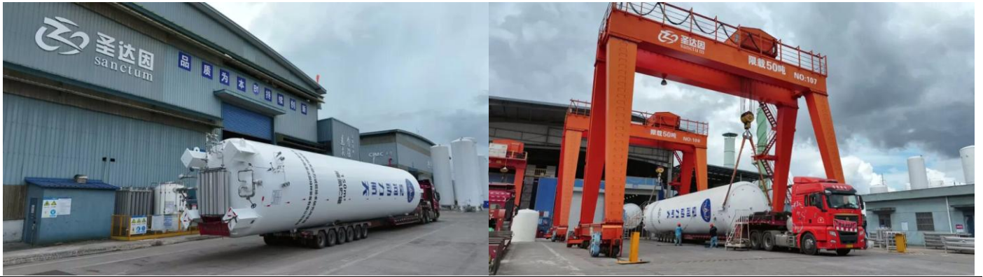
图表 2：商业航天业务 - 大型低温液氧储罐