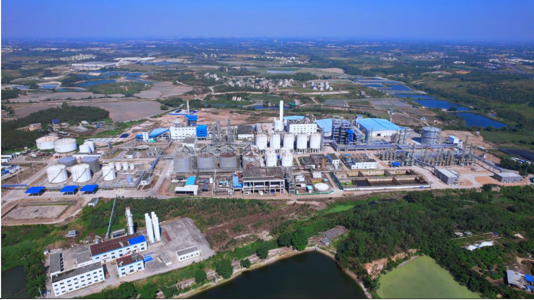
图表 1：广东湛江绿色甲醇项目