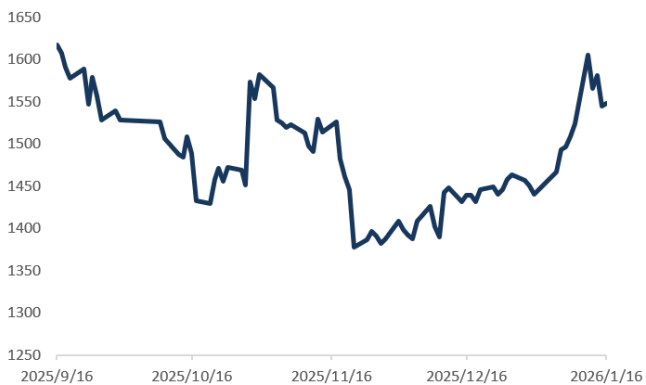
图1: 北证 50 指数月度表现