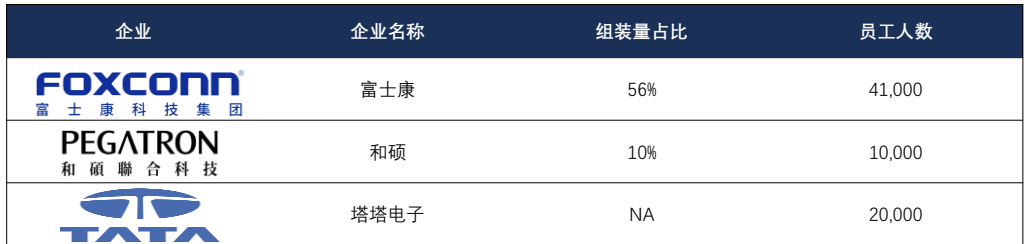
图表3：苹果主要生产企业产能与人员规模对比

iPhone 17系列这一代产品不仅在外观上实现了近五年来最大幅度的革新，更代表着苹果在全球供应链布局上的一次关键转折。据彭博社报道，本次iPhone 17系列将首次在新品首发阶段由印度五家工厂同步生产，全面供应美国市场的完整机型。这意味着印度不再只是配角，而成为苹果新品发布的重要生产中心，标志着苹果逐步从“中国制造”迈向“全球分布式制造”。这一举措背后，是库克多年来持续推动的供应链分散化战略。自特朗普时期贸易摩擦和关税政策不确定性上升以来，苹果不断减少对单一国家的依赖，通过在中国境内外各配置三家核心供应商，降低潜在风险并增加供应链灵活性，以确保在全球任何地区发生突发事件时，产品仍能如期交付。