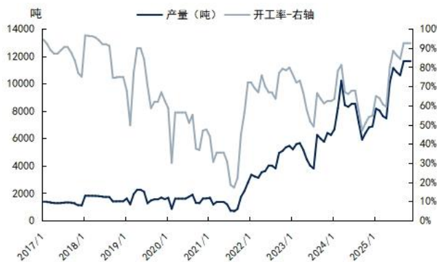
图4: 中国草铵膦月度产量、开工率