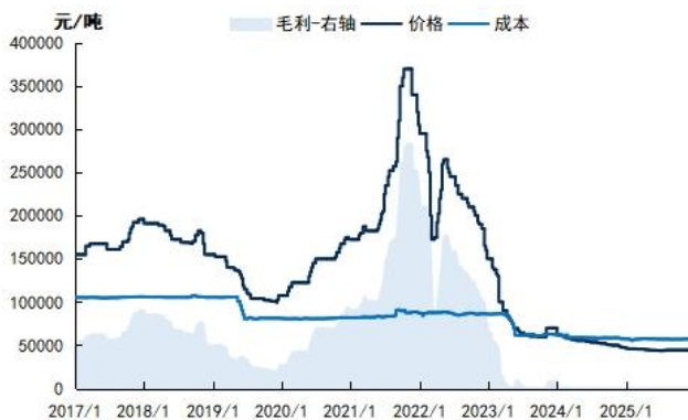
图3: 草铵膦价格、成本、毛利