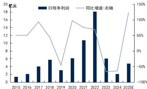
图2：利尔化学归母净利润及同比增速