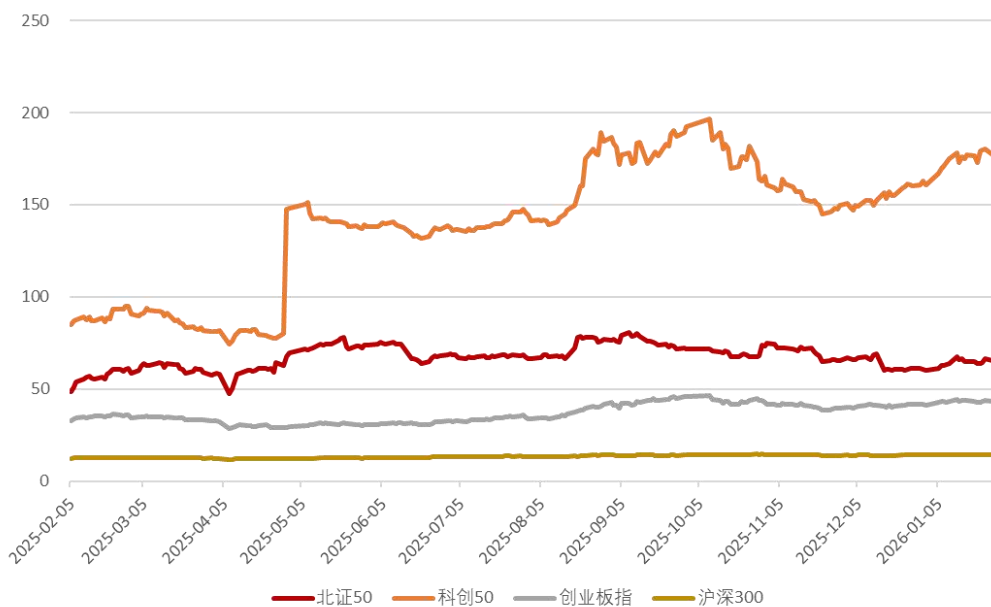
图 3: 市场主要板块 PE (截至 2026 年 1 月 29 日)

截至 2026 年 1 月 29 日, 北证 50 指数 PE (TTM) 均值 64.50 倍, 中位数 64.74 倍; 创业板指 PE (TTM) 均值 43.24 倍, 中位数 43.21 倍; 科创板 PE (TTM) 均值 175.49 倍, 中位数 176.28 倍。