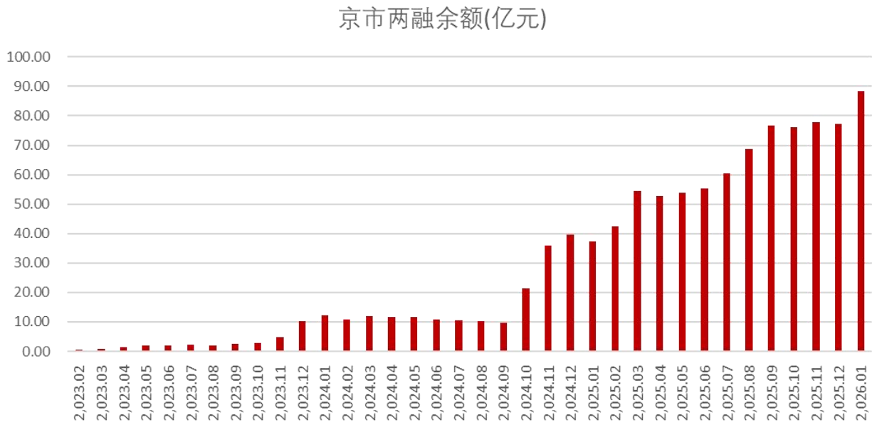
图 5：北交所融资融券余额及新增额（截至 2026 年 1 月 29 日）

截至 2026 年 1 月 29 日，北交所 1 月份日均融资融券余额为 88.26 亿元，环比增长 14.04%。