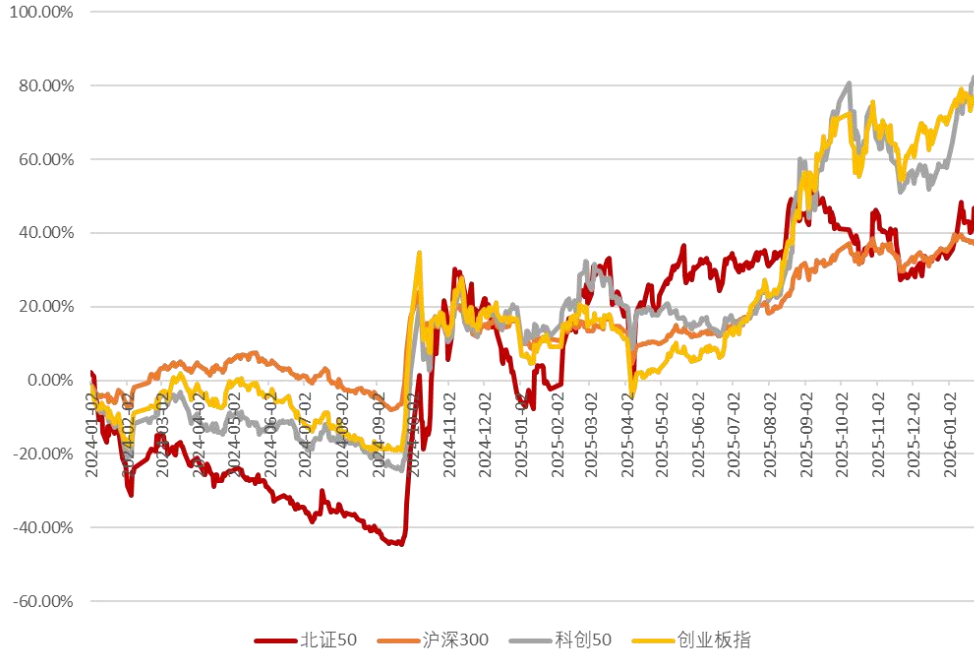
图2：市场主要板块指数行情（截至2026年1月29日）