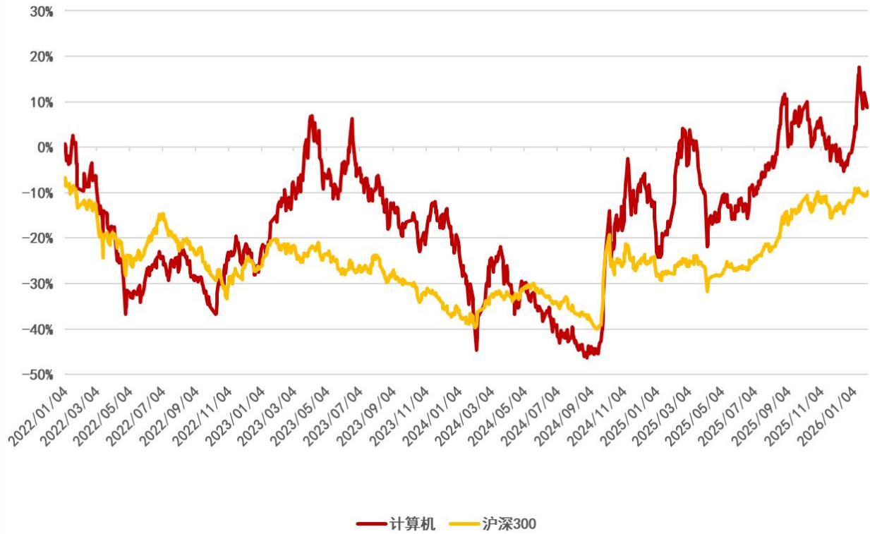
图 1：申万计算机行业 2022 年初至今行情走势（单位：%）（截至 2026 年 1 月 29 日）

申万计算机板块近 2 周（2026/1/16-2026/1/29）累计下跌 5.32%，跑输沪深 300 指数 5.37 个百分点，在 31 个申万一级行业中排名第 31 名；申万计算机板块 1 月累计上涨 9.08%，跑赢沪深 300 指数 6.40 个百分点；申万计算机板块今年累计上涨 9.08%，跑赢沪深 300 指数 6.40 个百分点。