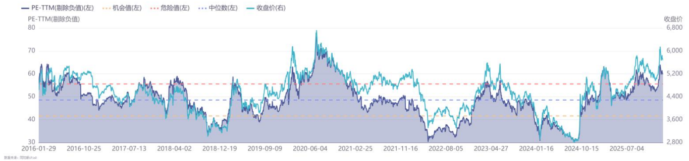
图 2：申万计算机板块近 10 年 PE TTM（单位：倍）（截至 2026 年 1 月 29 日）

截至 2026 年 1 月 29 日，据同花顺数据显示，SW 计算机板块 PE TTM（剔除负值）为 59.79 倍，处于近 5 年 96.66%分位、近 10 年 91.70%分位。