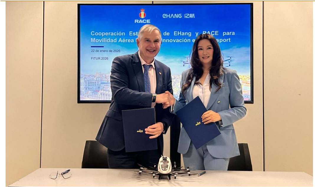
图 2: 亿航智能与西班牙皇家汽车俱乐部签署战略合作