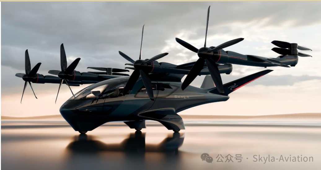
图 5：Skyla Aviation 飞行器

蓝色向量成功完成 Pre-A++轮融资，融资总额达数千万元。本轮融资由老股东厚雪资本领投，新能源产投尚理投资跟投。SKYLA V30 是一款严格遵循“商用航空级别安全标准”、采用“开放式系统架构”的 6 座、2 吨级 eVTOL 飞行器，与 2025 年 12 月完成构型验证机首飞，2026 年 1 月完成倾转过渡试飞。