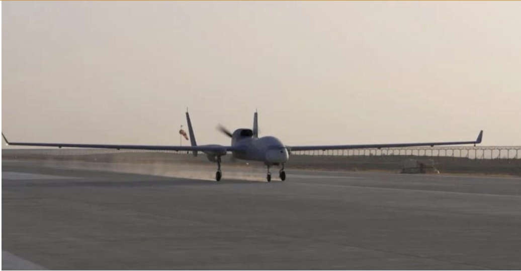
图 4：纵横股份“云龙-1P”无人机

纵横股份自研吨级无人机“云龙-1P”完成首飞。“云龙-1P”无人机是纵横股份面向未来广阔民用市场打造的新一代吨级通用平台。该机型采用高效稳定的双尾撑布局，集高载重、强适应与卓越经济性于一体。其最大起飞重量可达 1200 千克，有效任务载荷能力高达 350 千克，并具备在 4500 米高原机场起降部署的强大能力，能够适应高原、岛礁等复杂环境作业需求。