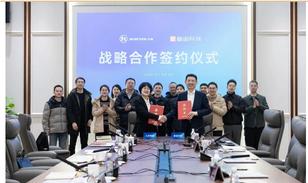
图 3: 四川九洲与普宙科技签署战略合作协议

四川九洲与普宙科技签署战略合作协议。双方将依托各自优势资源, 在低空经济、智慧城市, 以及在推动面向复杂环境和多应用场景的无人机/机库/载荷、红外技术、AI人工智能、综合管理平台等创新及相关业务方向上展开合作, 同时建立常态化沟通机制, 着力构建优势互补、互利共赢的产业生态。