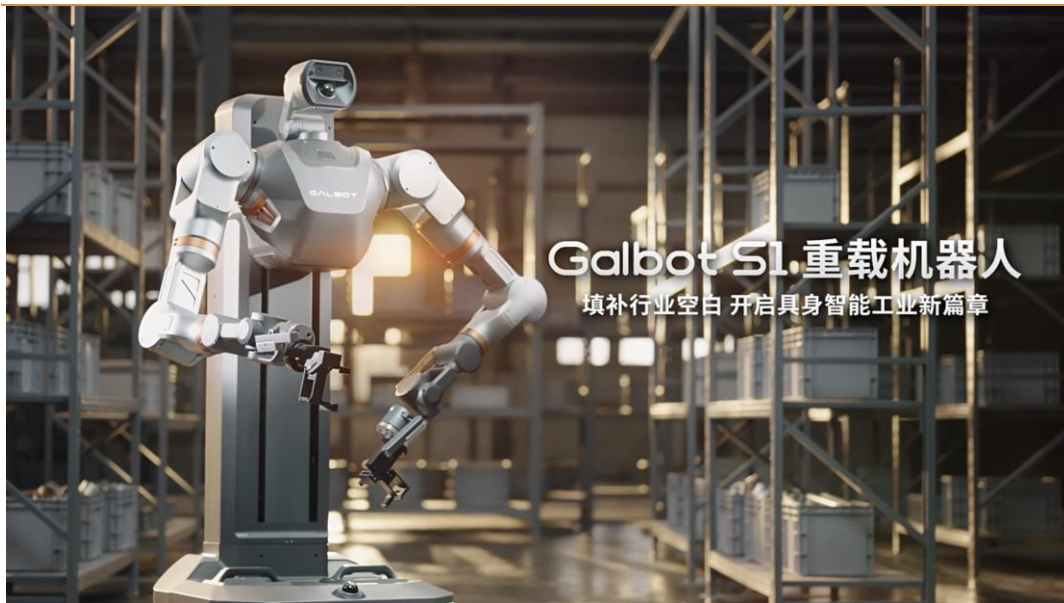
图 3: 银河通用发布首款工业级重载机器人 Galbot S1