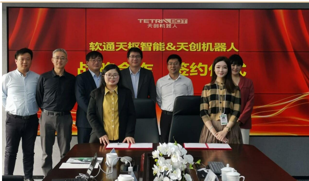
图 4: 天创机器人与软通天枢达成战略合作

天创机器人与软通天枢(软通动力子公司)达成战略合作。双方将集合优势资源, 面向在能源、电力、钢铁、工厂、园区等场景, 就具身智能机器人、数字孪生感知执行系统平台等智慧运维产品展开深度合作。