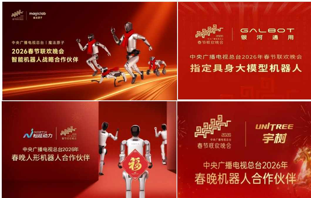
图表5: 四家具身厂商合作总台春晚