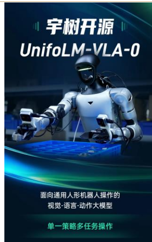
图表4：宇树科技正式开源其通用人形机器人操作大模型

作”的链路，大幅降低研发成本。同时，该模型实现的“单一策略多任务”能力，也为机器人从“只能做特定任务”向“能适应开放场景”提供了可行路径，UnifoLM-VLA-0 让“一个模型应对多种操作”成为可能。