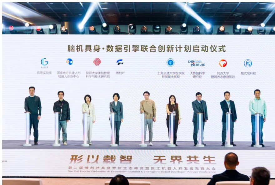
图表7：第二届傅利叶具身智能生态大会暨张江机器人开发者先锋大会

在此基础上，傅利叶还联合上海交通大学医学院附属瑞金医院、复旦大学类脑智能科学与技术研究院、天桥脑科学研究院、国家地方共建人形机器人创新中心、同济大学附属养志康复医院、格式塔科技和临港实验室共同发起“脑机具身·数据引擎联合创新计划”，以核心硬件、工具链等底层技术持续支持探索脑机接口与具身智能体的深度融合，验证面向未来的人机交互闭环体系。