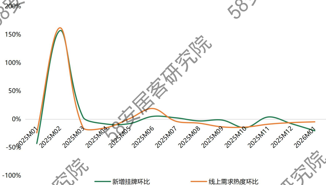
全国40城租赁市场供需环比情况

在一线城市中，北京的需求热度环比基本保持持平，而广州和深圳的需求热度环比降幅明显，分别下降了8.3%、9.3%。与此同时，有9个城市的需求热度环比降幅超过10%。临近年末，三亚、海口、哈尔滨及长春等旅游城市的需求热度峰值已过，环比降幅相对较为显著。