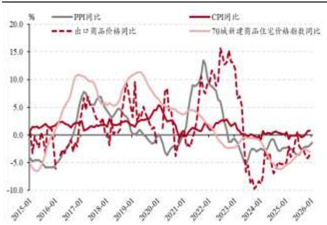
图表 3. PPI 与主要下游价格指标