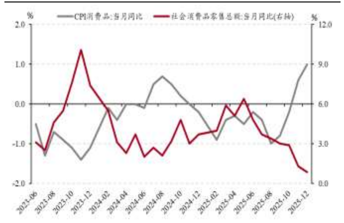
图表 4. CPI 消费品价格涨幅与社零消费增速