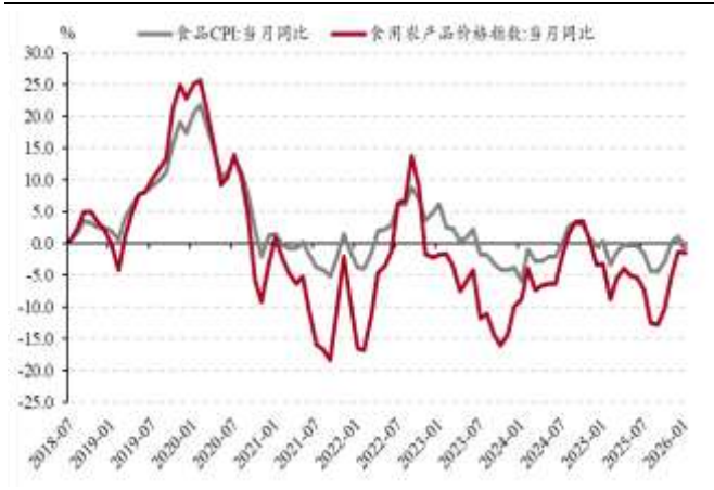
图表 1. 食品类 CPI 与食用农产品价格