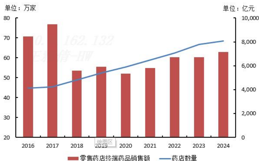
图2 2016~2024年我国零售药店终端药品销售额与药店数量统计